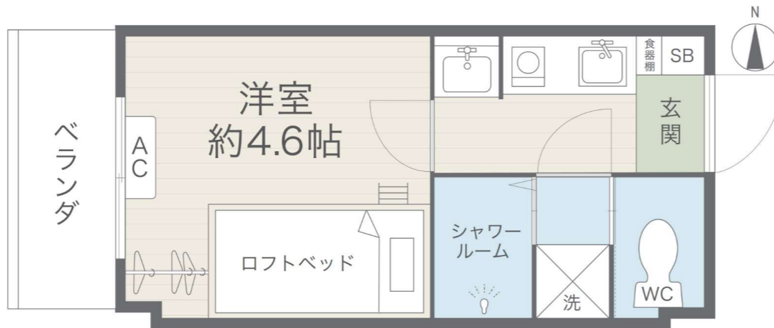
2023年9月リニューアル